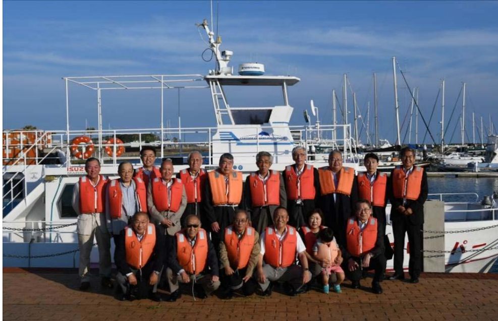
最終例会（船上例会）